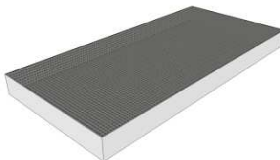
Version avec caillebotis : BG0080C