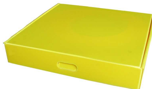
Nouvelle boîte de rangement : solide et résistante – Avec poignée