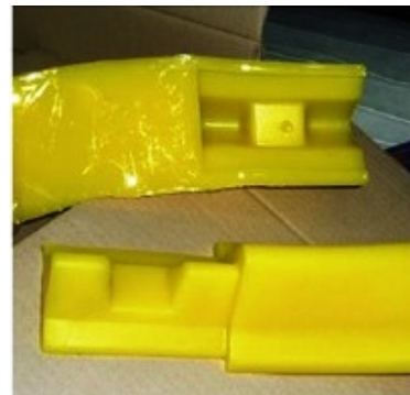
Connecteurs Mâle / Femelle aux extrémités - Poignées