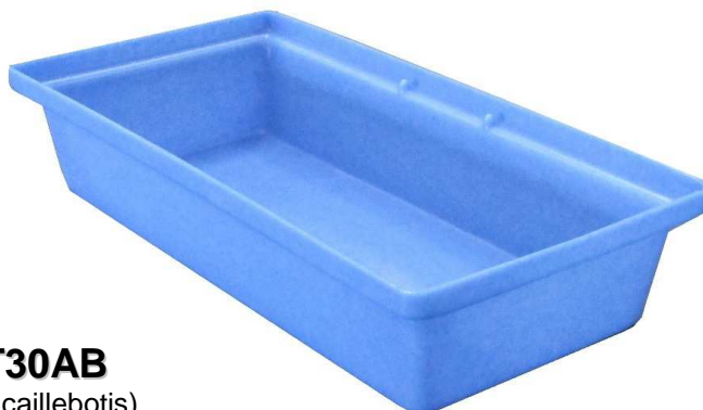
ST30AB (sans caillebotis)