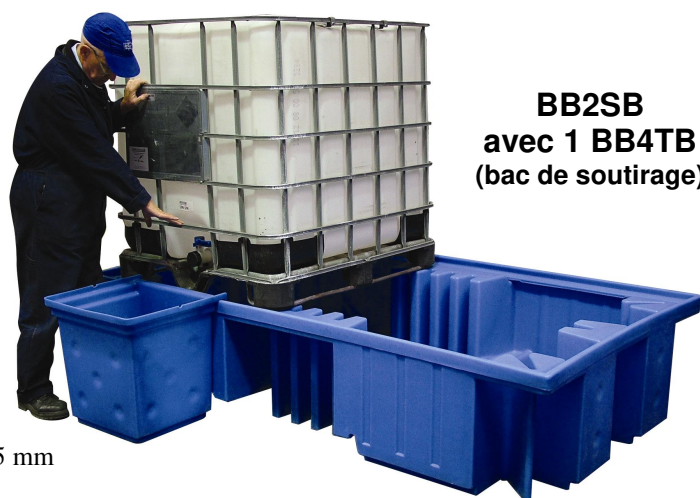
BB2SB avec 1 BB4TB (bac de soutirage)

Bac sans caillebotis pour dépose directe d'une ou deux palettes. Avec passage de fourches pour manutention